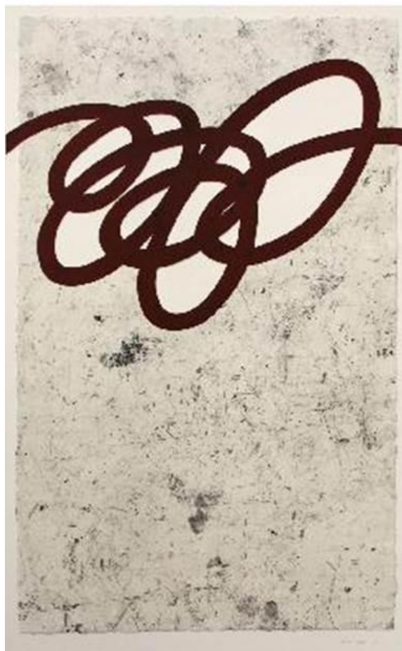
“De draad van Ariadne III”

Donderdag 25 september om 19u30 in Leuven Schrijf je gratis in bij filiaalhouder Frieda